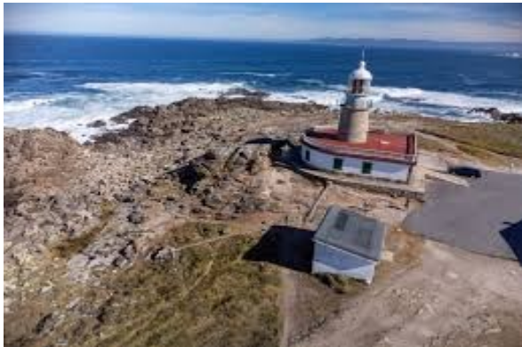
Faro de Corrubedo

10:45h.- Visita ao museo Valle Inclán, A Pobra do Caramiñal