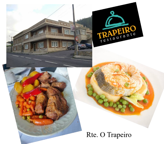
Rte. O Trapeiro

Ás 14:45h xantar no restaurante O Trapeiro de Noia.