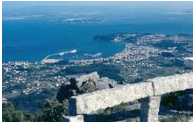
Mirador de A Curota

13:30h.- Chegada a o mirador do monte Curota