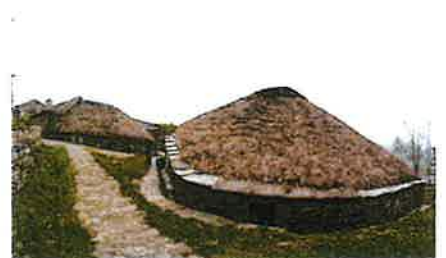
Museo etnográfico de O Cebreiro

Despois de xantar, sobre ás 15:15h, nos dirixiremos ás Pallozas de O Cebreiro con chegada sobre ás 16h