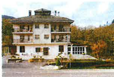
Rtc. A Veiga

Ás 13:45h xantaremos no hotel "A Veiga" moi preto do mosteiro.