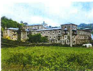
Abadía de Samos

Faremos unha parada a medio camiño do Mosteiro de Samos, chegaremos alí sobre as 11:30h.